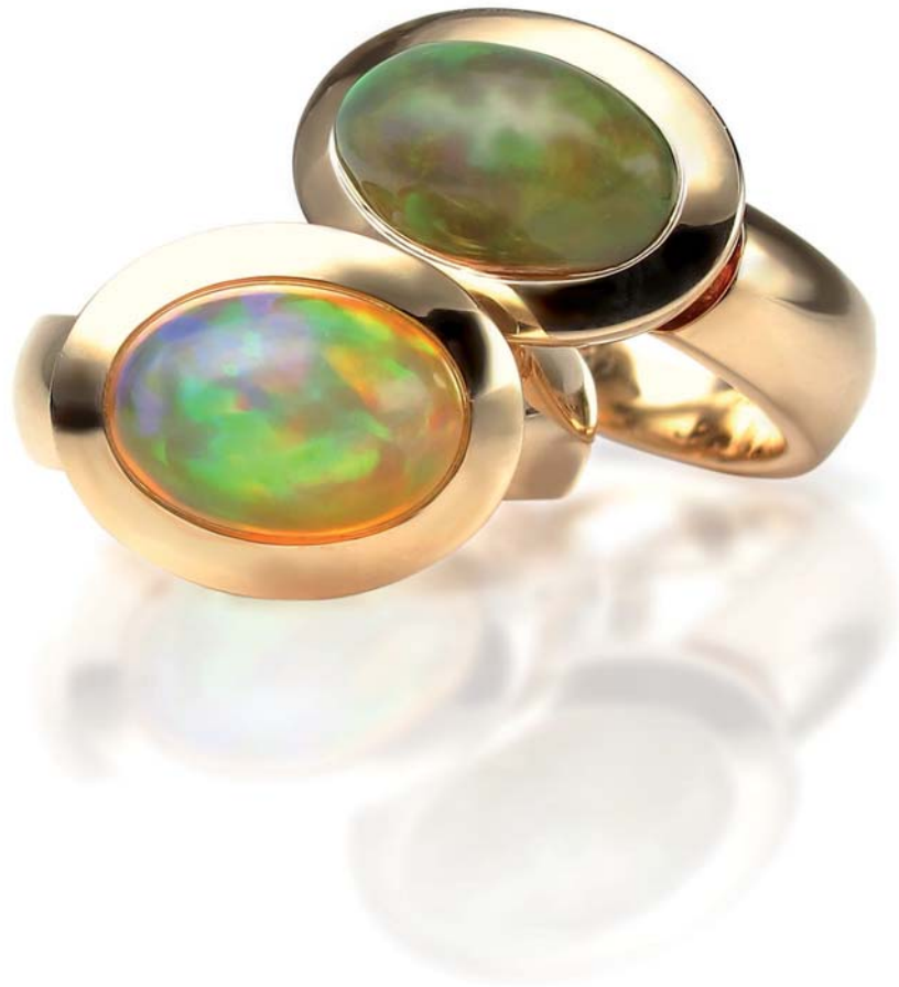
Kollektion „Just Simple New Generation“