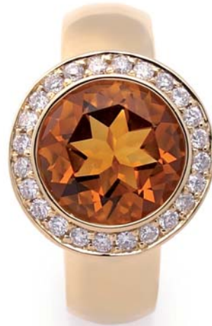
Kollektion „Just Simple petite“